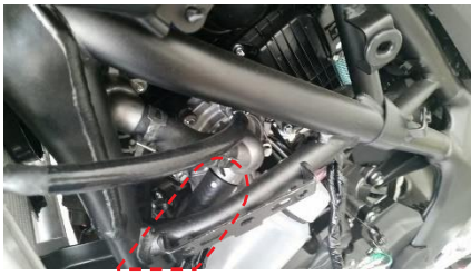
カットするホース