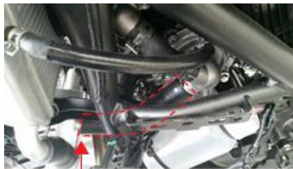
ホース A (注※見やすいようにホースバンドを外しています)